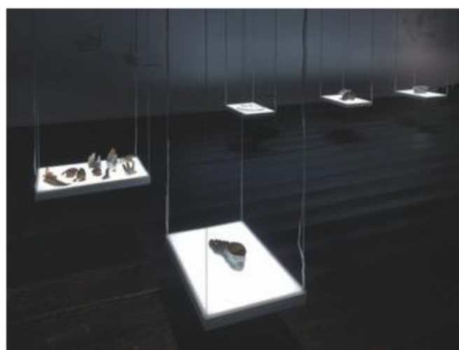
INFLECTED OBJECTS #2 CIRCULATION - MISE EN SCEANCE (2016) Tentoonstellingsoverzicht, De Hallen Haarlem.